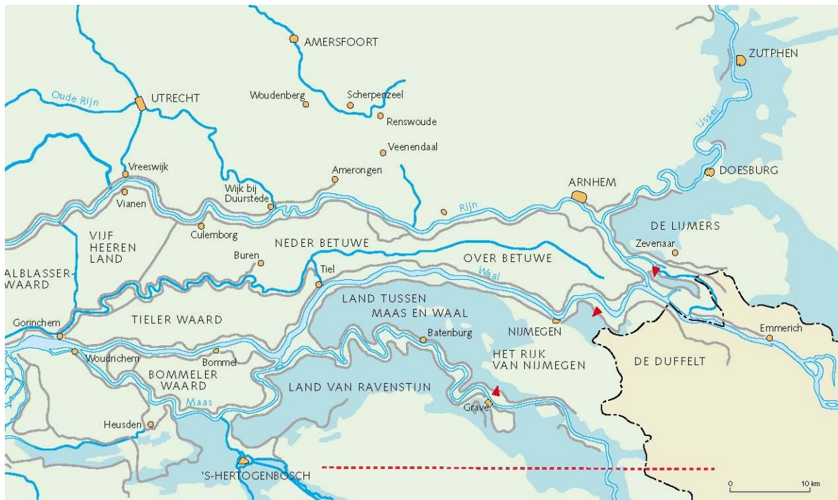
Figuur 2. Bijschrift: “Kaart van de overstromingen in 1926. Langs de Rijntakken werden door dijkdoorbraken alleen kleine gebieden onder water gezet. (...) De grote overstromingen werden veroorzaakt door het doorbreken van de dijken langs de Maas zowel aan de Gelderse als aan de Brabantse kant.” (Bron: Van der Ham 2004, Afb.T blz.67)

Dit kaartje laat goed zien dat de overstromingen van de Maas in 1926 vooral aan de Brabantse (Beerse overlaat) en Gelderse kant (Land tussen Maas en Waal) plaatsvonden. Gennep ligt op ongeveer dezelfde breedtegraad als 's Hertogenbosch, dat heb ik met het rode stippelijntje aangegeven.