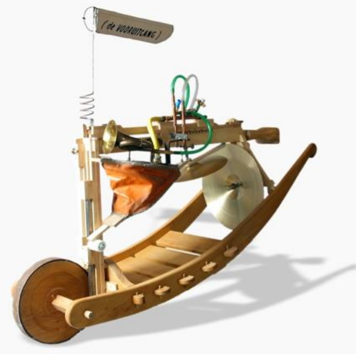
DE VOORUITGANG [Jaap Glandorff, 2011]

De gemeente Gennep is van oudsher een plek waar creatieve geesten zich op hun gemak voelen. Het is ook niet voor niets dat Gennep rijk is aan kunstenaars van zeer uiteenlopende aard. We zijn daar als gemeente trots op, immers: kunst zet mensen aan het denken, geeft nieuwe waarde en oriëntaties en stimuleert mensen in hun eigen creativiteit 0 . Kunstenaars zijn de cultuurmakers en zijn van groot belang in de cultuursector en brengen sprankelende en verrassende initiatieven voort.