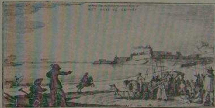
Algestaan door P. V. Janssen, drukkerij, Genneep.

de selve dagh bracht men al het geschut op de batterijen, en men maecte gereetschap, om de belegerde van verscheyde sijden te beschieten. Het leger stont oock dese en de volgende nacht in slaghorde; overmits het scheen, dat de Spaenschen hun voornemen pooghden te hervatten, doch sy quamen niet aen; maer lieten haer, niet wijt van des Graven van Hoorns quartier, met omtrent 18 cornetten ruyters, nevens een goet getal vuer-roers, in 't vlacke velt sien; en dreven de wercklieden, die buyten het quartier eenige wercken maecten, weder binnen; doch giengen daerna van hier naer Kranenburgh. Sijn Hoogheyt beval eenige ruyters haer