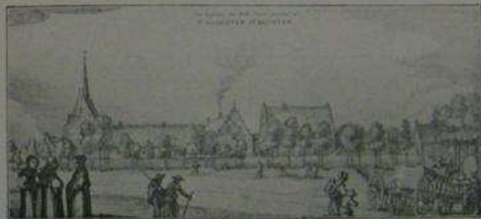
Algestaan door P. V. Janssen, drukkerij, Gennep.

heydt hier uyt voor hen onstaen, 't selve Huys te belegeren, en, soo 't mogelijk was, den Spaenschen uyt de handen te wringen. Tot desen eynde is Sijn Hoogheyt de Prins van Oranje den VII Junii in 't jaer MDCXLI met der Staten leger van Lit en Littoyen, daer hy eenigen tijdt gelegen en sijn volck vergadert had, opgebroken; en nam sijn wegh naer de Grave, daer noch verscheyde cornetten ruyteren uyt de Geldersche en Over-Ysselsche garnisoenen by hem quamen.