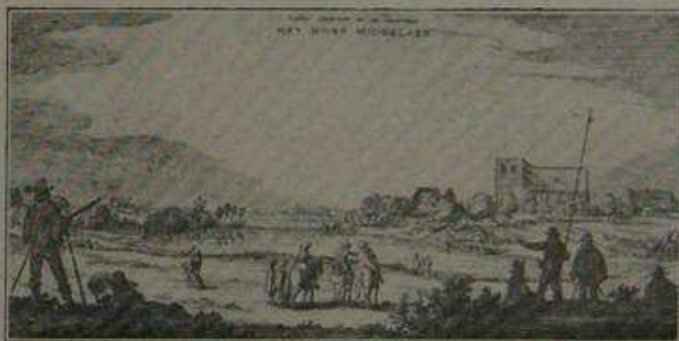
Algestaen door P. V. Janssen, drukkerij, Gennep.

kinderen, huys-raet en andere goederen. Daer na quam een Sergeant met eenige vuerroers; en noch 119 wagens, als de vorige geladen. Toen quamen twee stucken geschuts, die yder van elf paerden getrocken wierden; en noch een ander stucken, dat men een Mansfelder noemt, daer vijf paerden voor gingen: hier op volghden noch 21 wagens, oock met menschen en goet geladen. Toen volghden twee cornetten curassiers van der Heeren Staten volck, om haer naer Venlo te geleyden. Na de selve quamen vier compagnien te voet, doch sonder vaendels; en daer na acht Vaendragers in twee geleiden, en achter hen het volck die daer onder behoorden.