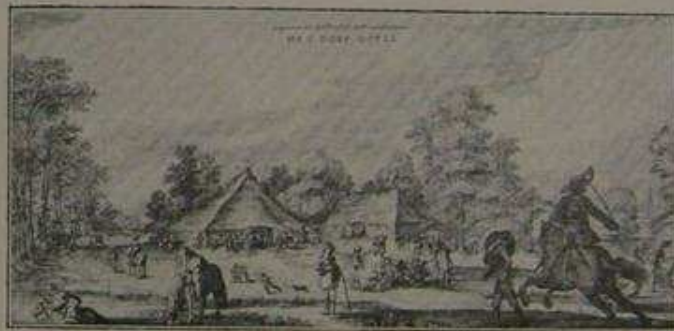
Algestaan door P. V. Janssen, drukkerij, Gennep.

Dus is dese Sterckte met het geheele leger omringt, en terstont door de Veltheer vijf hoofd-quartieren verordent, als sijn eygen, dat van Graaf Willem van Nassou, den Oversten Ferens, de Graef van Hoorn, en Graef Hendrick van Nassou; dese wierden in aller haast afgesteken, en nevens de geheele circumvallatie oft omtreck soo spoedigh opgemaect en voltrocken, datse in acht dagen in volkomen defentie waren. In die tijt quamen eenige vrouwen, met toestaan van Sijn Hoogheyt, uyt het kasteel, en meenden in 't stedeken Gennep te blijven, maer moesten terstont van daer vertrecken: dies sy haer naer Venlo en Roermond begaven. De belegerde schoten sterck op het leger; terwijl de Prins het Huys te